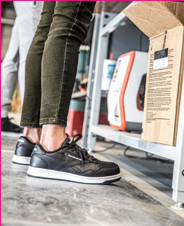
RBMX157 CLUB MEMENT WORK TALLAS / 22-27 MEX