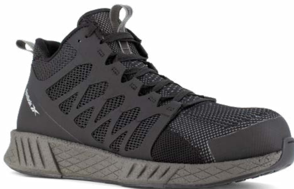
RBMX453 SPEED TR WORK ANTIESTÁTICO TALLAS / 22-27 MEX