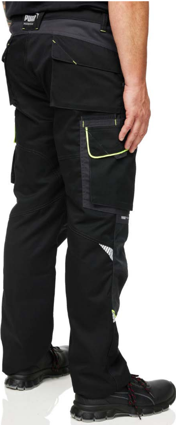
PU-30-1100-NE PANTALÓN DE TRABAJO PRECISION X NEGRO-NEÓN TALLAS / 30 - 40 MEX